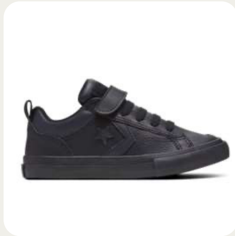
45E-02 CONVERSE ➤