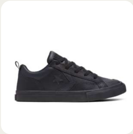
45E-01 CONVERSE ➤