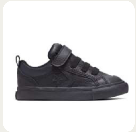
45E-03 CONVERSE ➤

⚠ Plus grand assortiment de produits en magasin. Il se peut que certains modèles diffèrent ou soient substitués par le fournisseur.